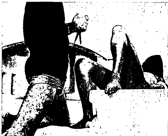
« Le Visage de la médusa », de Nicos Koundouros.

reste aux techniciens devenus méfiants ou exigeants : pour le reste, ils sont contraints de recourir au crédit. Des records sont établis : on tourne en moins de quinze jours ; on fabrique des longs